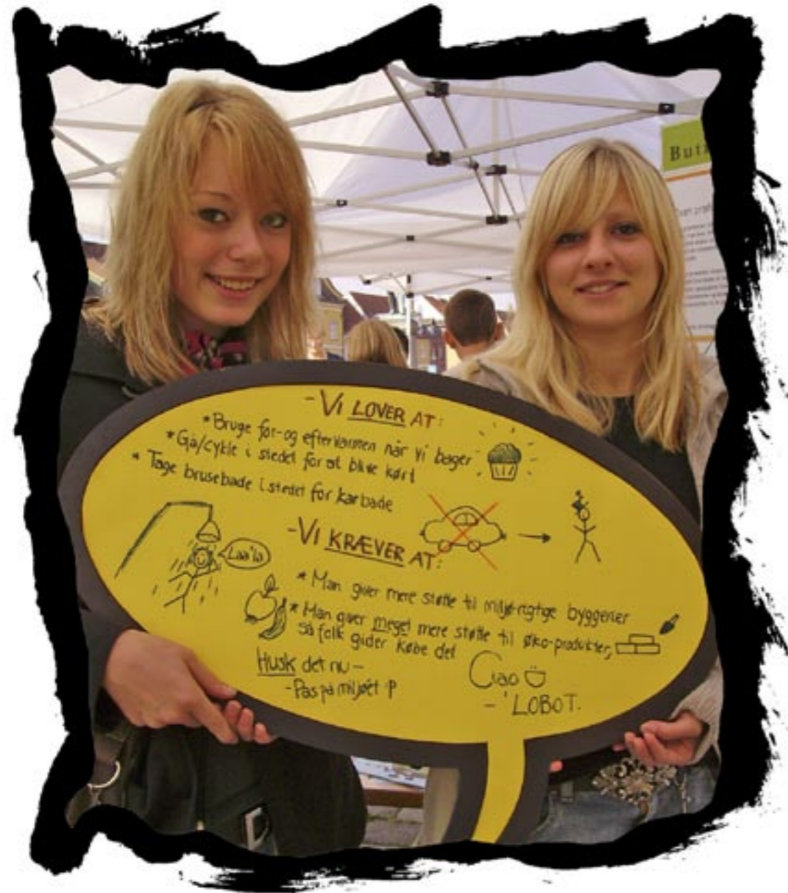
Vi lover at: Bruge for- og eftervarmen, når vi bager. Gå/cykle i stedet for at blive kørt. Tage brusebade i stedet for karbade. Vi kræver at: Man giver mere i støtte til miljø-rigtige byggerier. Man giver meget mere i støtte til øko-produkter, så folk gider købe det. Husk det nu – Pas på miljøet P