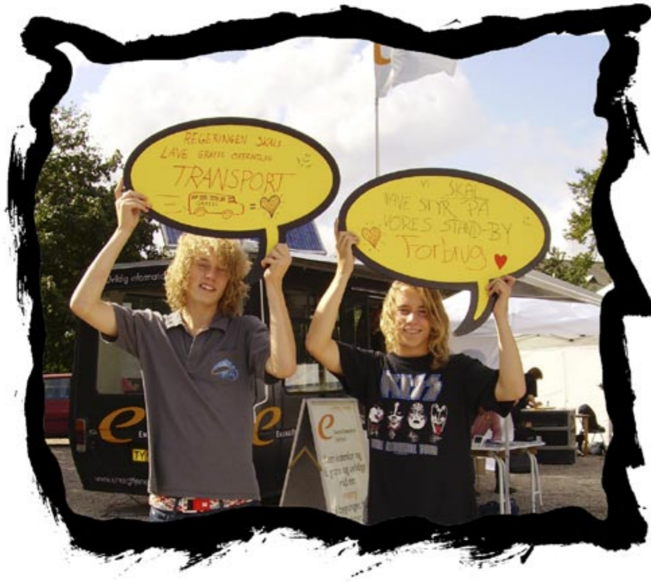
Regeringen skal lave gratis offentlig transport. Vi skal have styr på vores 'stand by' forbrug.

Odense, Kongens Have 7 – 8 September 2006