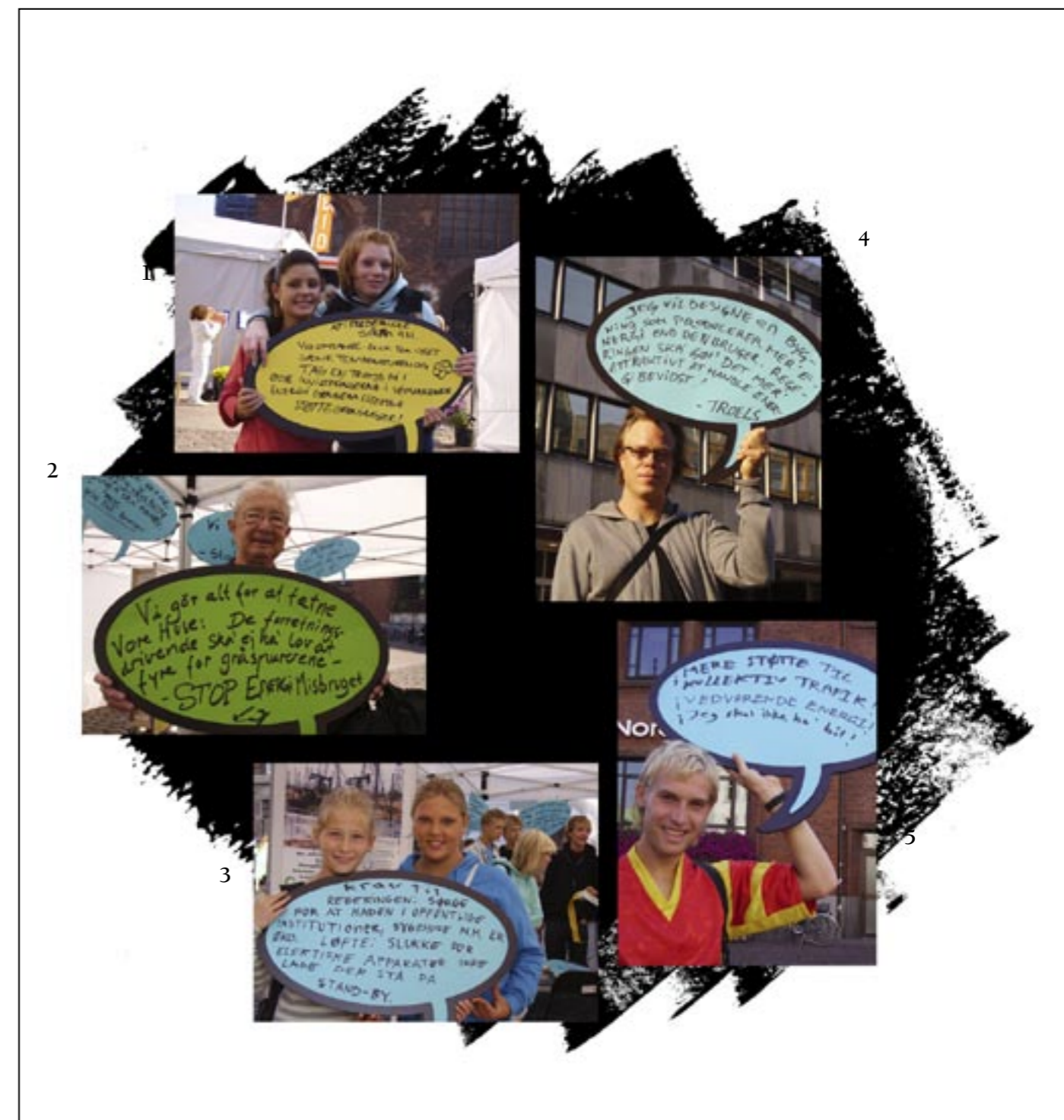
1. Vis omtanke. Sluk for lyset, sænk temperaturen og tag en trøje på! Krav: Regeringen skal øge investeringerne i vedvarende energi gennem effektive støtteordninger.