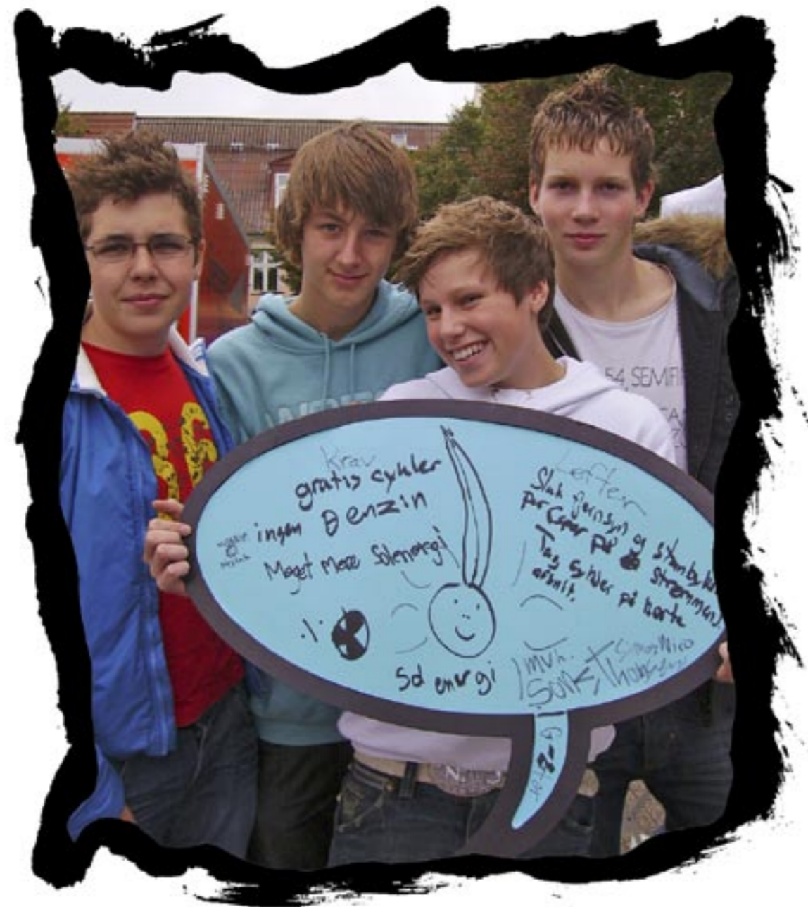
Løfte: Sluk fjernsyn og standby knap. Tag cyklen på korte afstande. Krav: Gratis cykler, ingen Benzin. Meget mere solenergi.