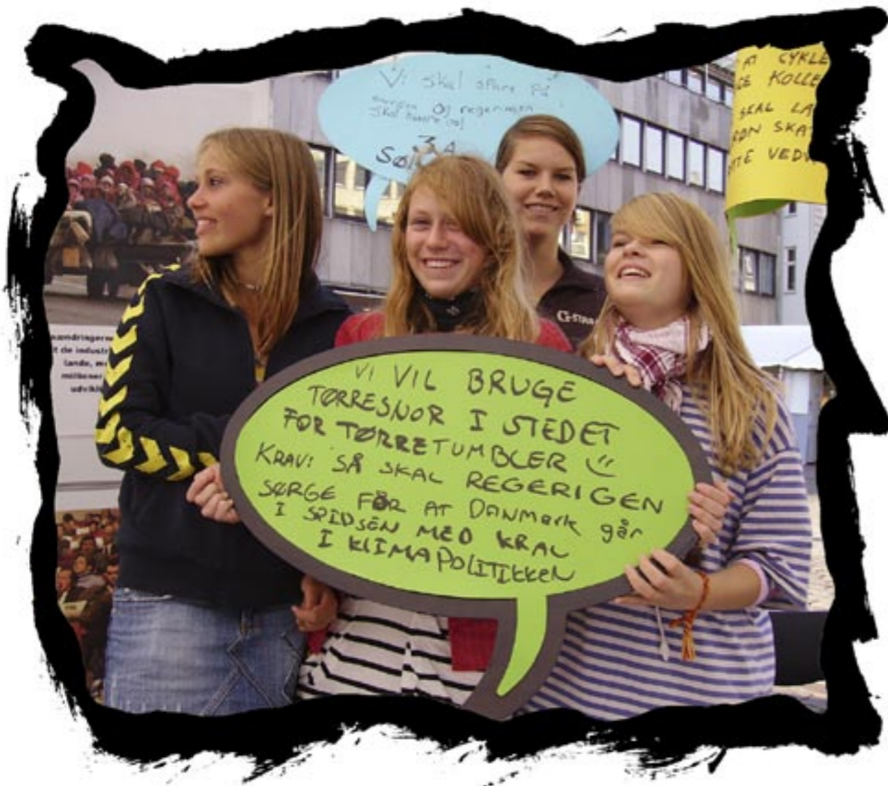
Vi vil bruge tørresnor i stedet for tørretumbler. Krav: så skal regeringen sørge for at Danmark går i spidsen med krav i klimapolitikken.