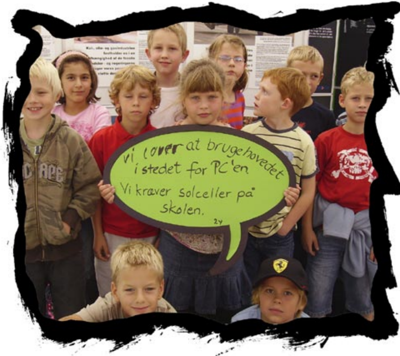
Vi lover at bruge hovedet i stedet for PC 'en. Vi kræver solceller på skolen.

Kolding, Vestertorv 11- 12 September 2006