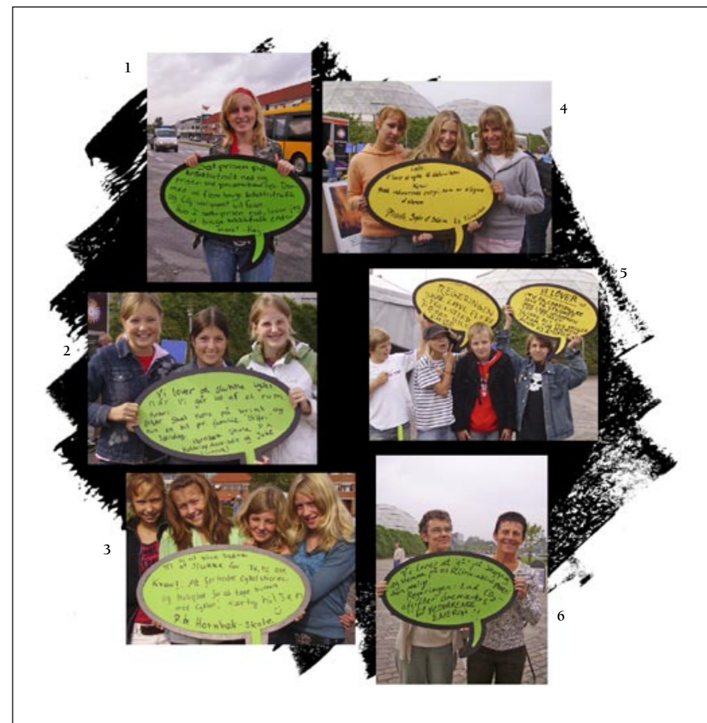
1. Sæt prisen ned på kollektiv trafik og prisen op på privat bilisme. Dermed vil flere bruge kollektiv trafik og Co2 udslippet vil falde. Hvis i sætter prisen ned, lover jeg at bruge kollektiv trafik endnu mere.

Randers, ved Randers Regnskov, 18-19 September 2006