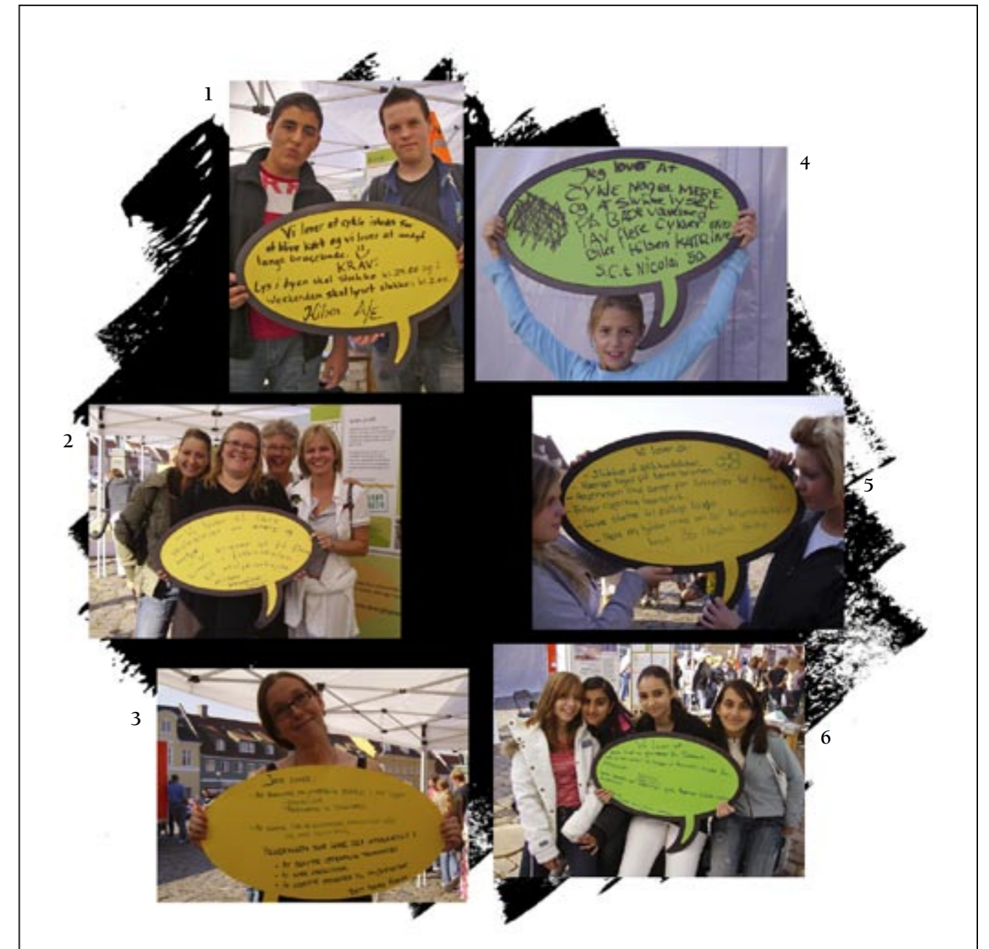
1. Vi lover at cykle i stedet for at blive kørt og vi lover at undgå lange brusebade. Krav: Lys i byen skal slukkes kl. 24.00 og i weekenden skal lyset slukkes kl. 2.00