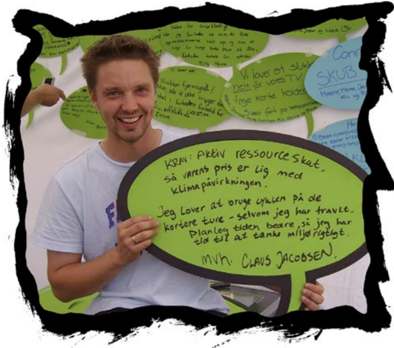
Krav: Aktiv ressource skat, så varens pris er lig med klimapåvirkningen. Jeg lover at bruge cyklen på de kortere ture - selvom jeg har travlt. Samt, planlægge tiden bedre, så jeg har tid til at tænke miljørigtigt.