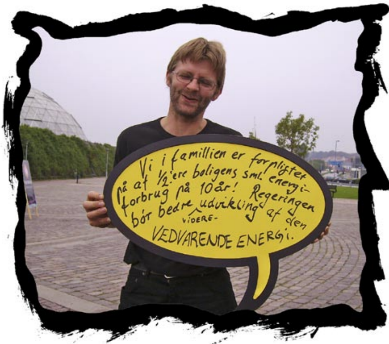
Vi i familien er forpligtet på at halvere boligens samlede energiforbrug på 10 år! Regeringen bør bedre videreudviklingen af den vedvarende energi!

Randers, ved Randers Regnskov, 18-19 September 2006