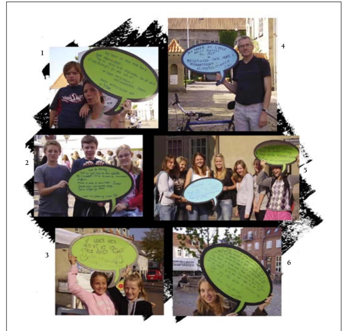
1. Jeg lover at lære mine børn gode energivaner. Jeg vil gerne bede regeringen om at være et godt eksempel for alle ved at bygge energipassiver/energiproducerende byggeri frem for prestigebyggeri m.m.